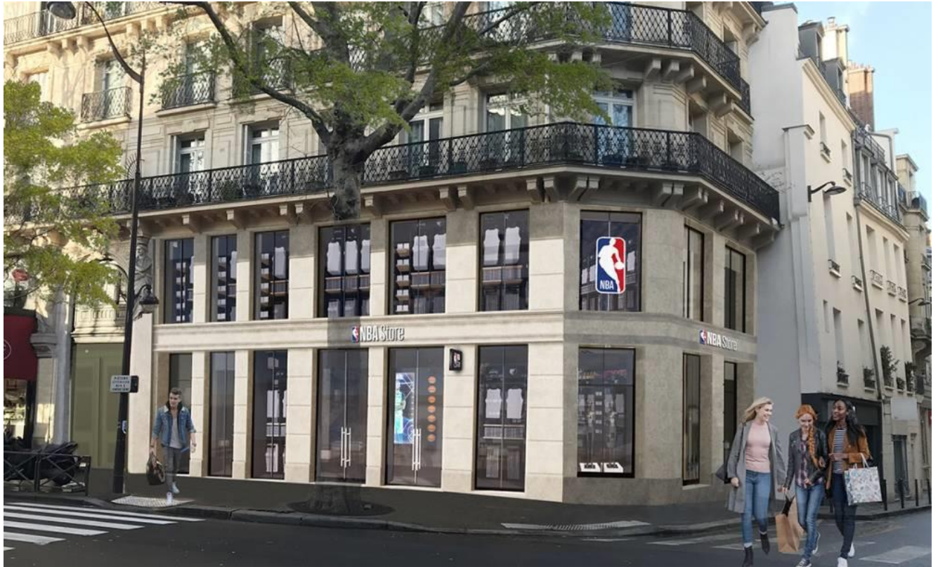
20 boulevard Saint-Michel, Paris 5 ème