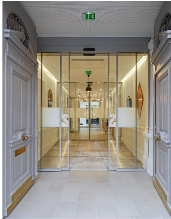
102 boulevard Malesherbes – Paris 17 e