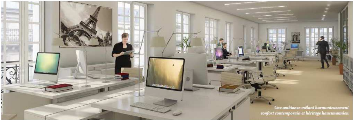
So Square Opéra Paris – 75008 Paris © Cabinet d'architectes Alain-Charles Perrot et Florent Richard