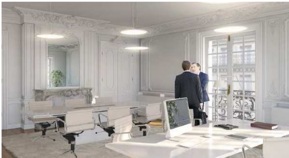
So Square Opéra Paris – 75008 Paris © Cabinet d'architectes Alain-Charles Perrot et Florent Richard

La commercialisation des locaux a été confiée à BNP Paribas Real Estate et Alex Bolton.